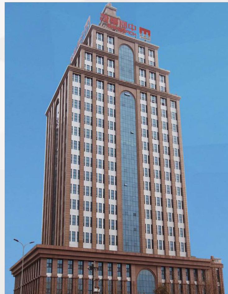
中原华信金融大厦 Finance Building of HuaXin

华信集团自成立以来，始终秉承“华诚于业，信始于行”的经营理念，以多元化战略为基本方向，以集团战略管控模式为基本手段，旗下各业务板块坚持以“平台合作、资源共享”为主要方式逐步向省内外进行扩张，依法经营、科学决策、制度管理、创新思维、稳健发展，不断以先进的信息化管理工具为抓手，建立完善有效科学的制度管理体系和绩效激励平台，并在不断开拓进取中持续改进。