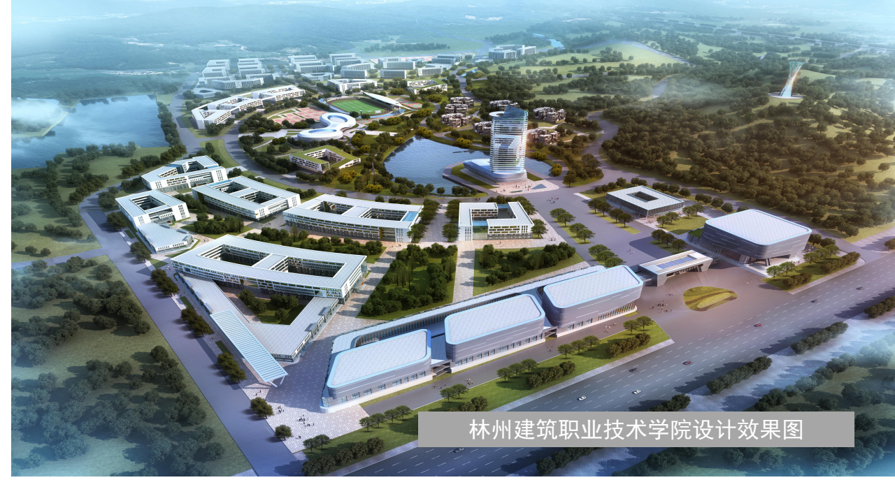
林州建筑职业技术学院设计效果图