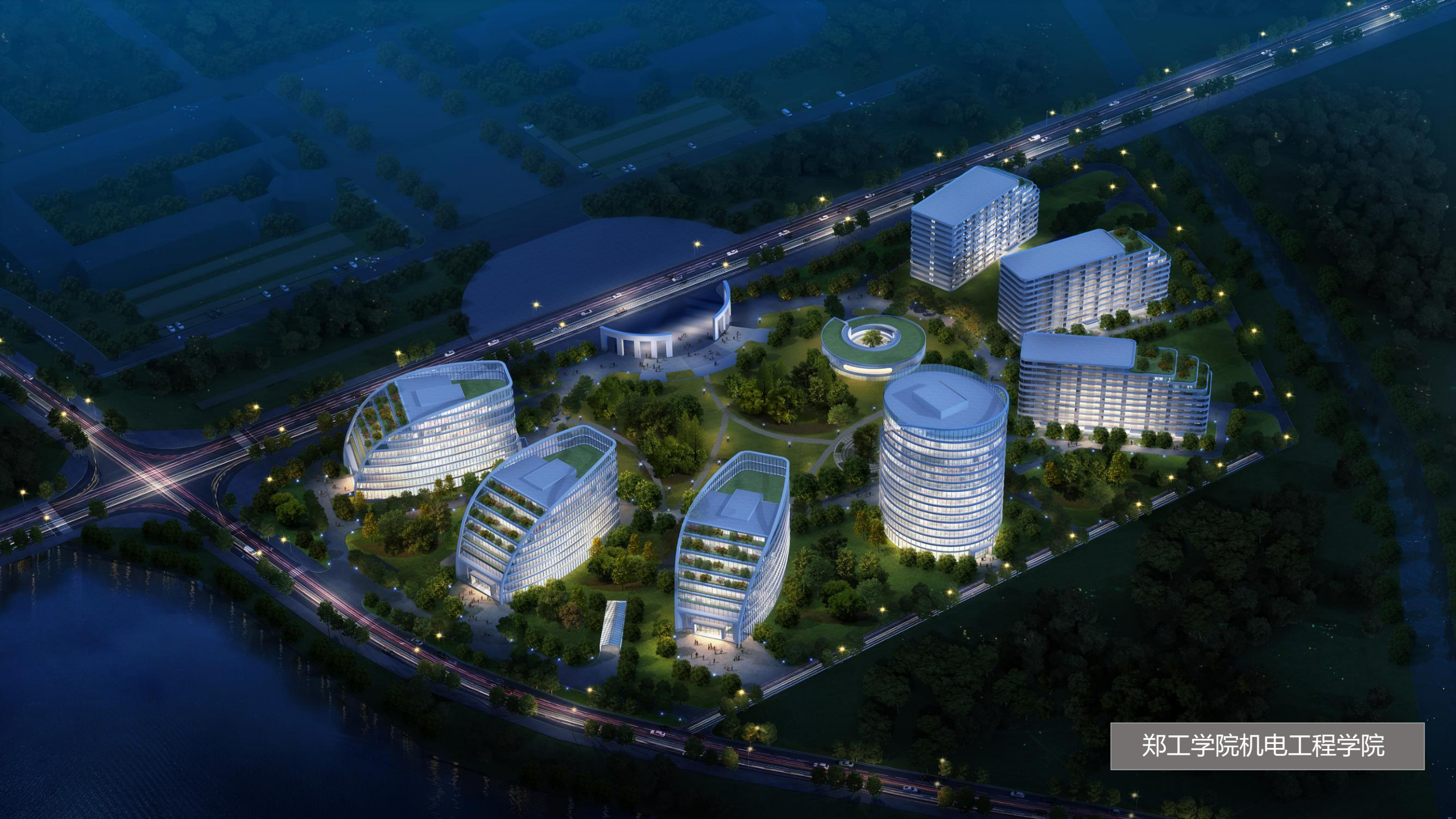
郑工学院机电工程学院