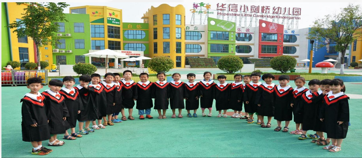
新郑市华信小剑桥幼儿园

幼儿园拥有家长全天可视系统，国家标准校车，专职的外教，另外幼儿园在既有的课程上，为幼儿设置了符合幼儿年龄特点的安全教育课程，培养幼儿初步的自我保护能力。