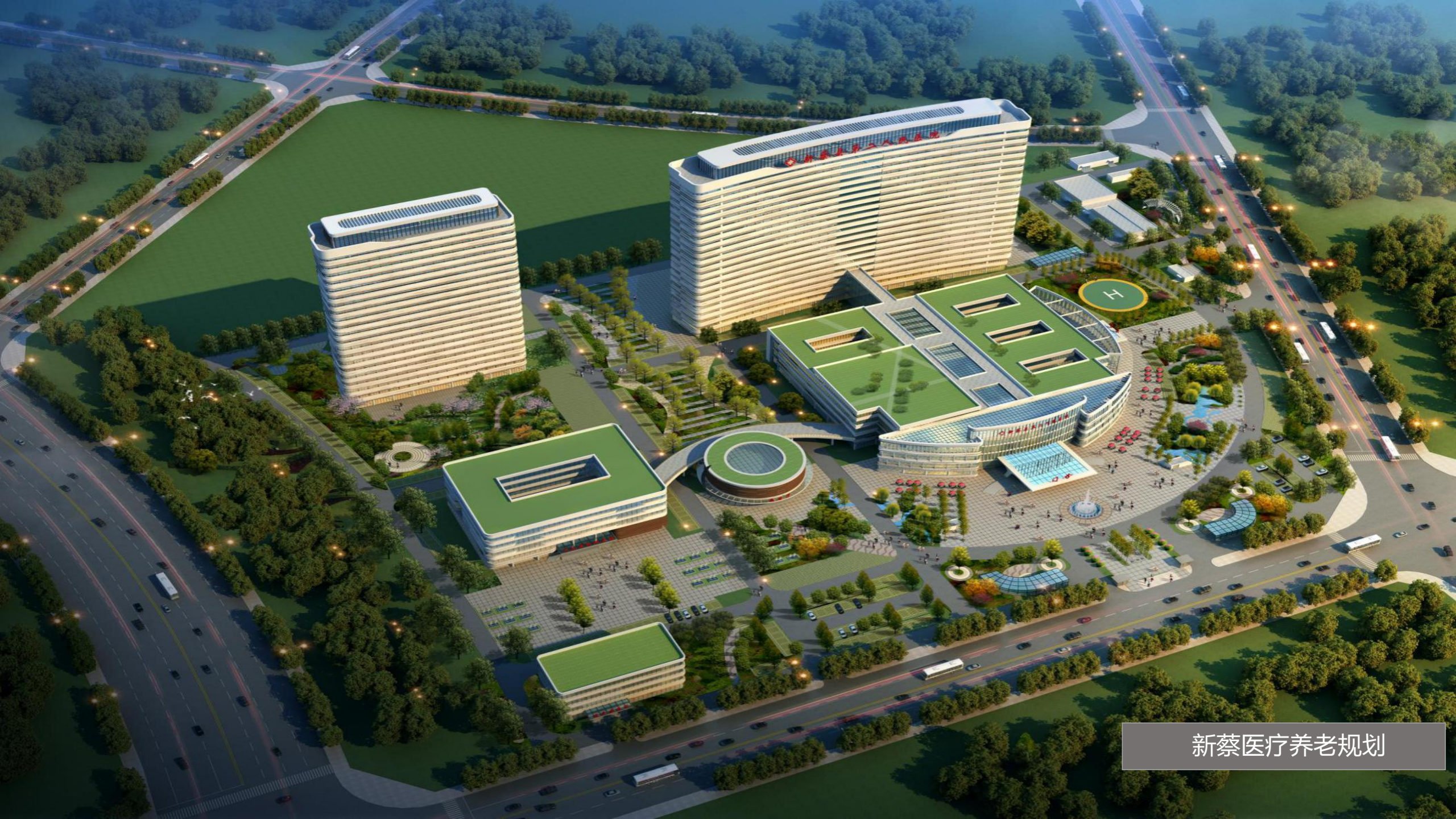
新蔡医疗养老规划