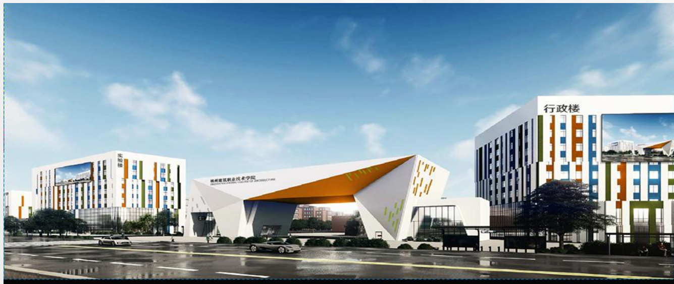
林州建筑职业技术学院

林州建筑职业技术学院是林州市人民政府与中原华信商贸集团合作，由中原华信商贸集团全资控股子集团—河南华信阳光教育科技集团投资建设的一所全日制普通高等职业院校。学院是河南省高等学校设置“十三五”规划中引入筹建的高等职业院校。2020年4月获得河南省人民政府正式批准设立。2020年秋季实现首批招生。学院位于林州市长春大道东段（与学院路交汇处），校园按照国际化、高标准进行规划建设，规划占地1500亩，总建筑面积66万平方米，首期已经征地1260亩，建筑面积已建成20万平方米。