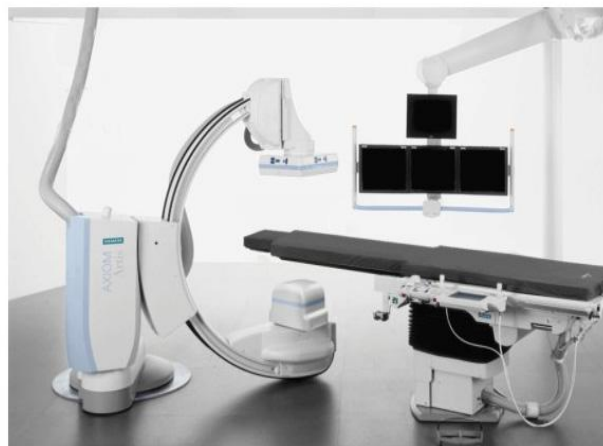
坐地式平板血管造影机（德国）