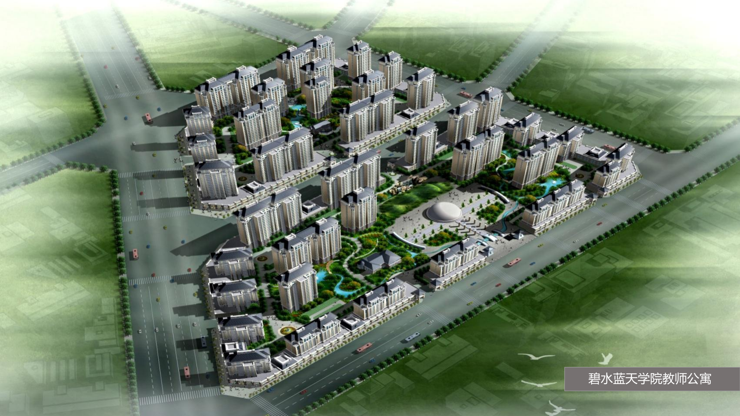
碧水蓝天学院教师公寓